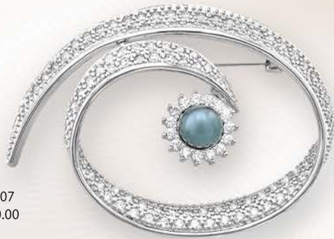
BH 9007 RM160.00