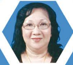
SM KHO LUONG IANG 28-0004934069