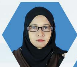
SSM ARJUNA BT MAT TEH 28-000724237