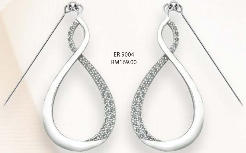
ER 9004 RM169.00