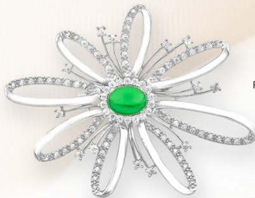
BH 9008 RM160.00

Syawal yang ditunggu-tunggu, Serba-serbi idam yang indah, Kini aksesori mewah menantimu, Aidilfitri lebih berseri dan meriah!