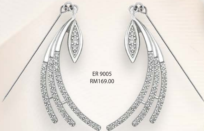
ER 9005 RM169.00