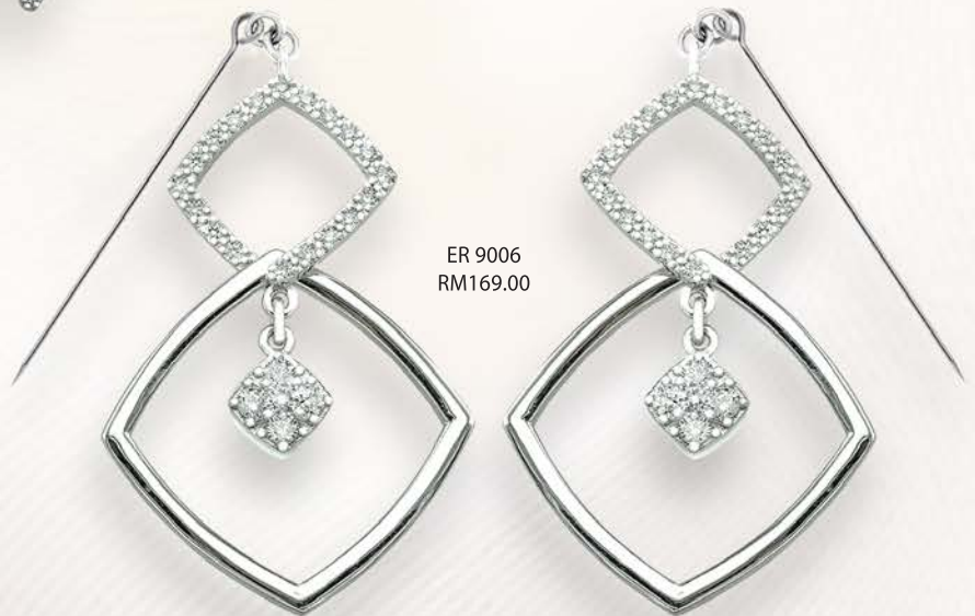
ER 9006 RM169.00